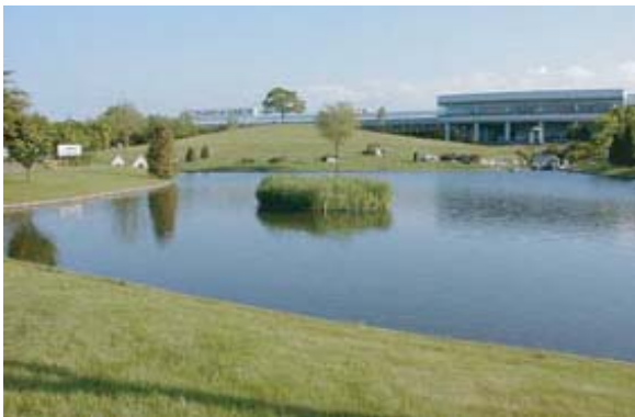
サッポロビール恵庭工場園池