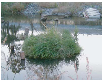
東京都森が崎ビオトープ池