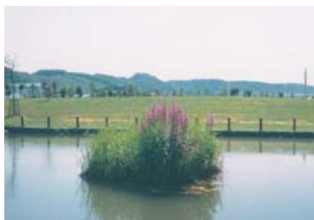
北海道幕別町いなほ公園池